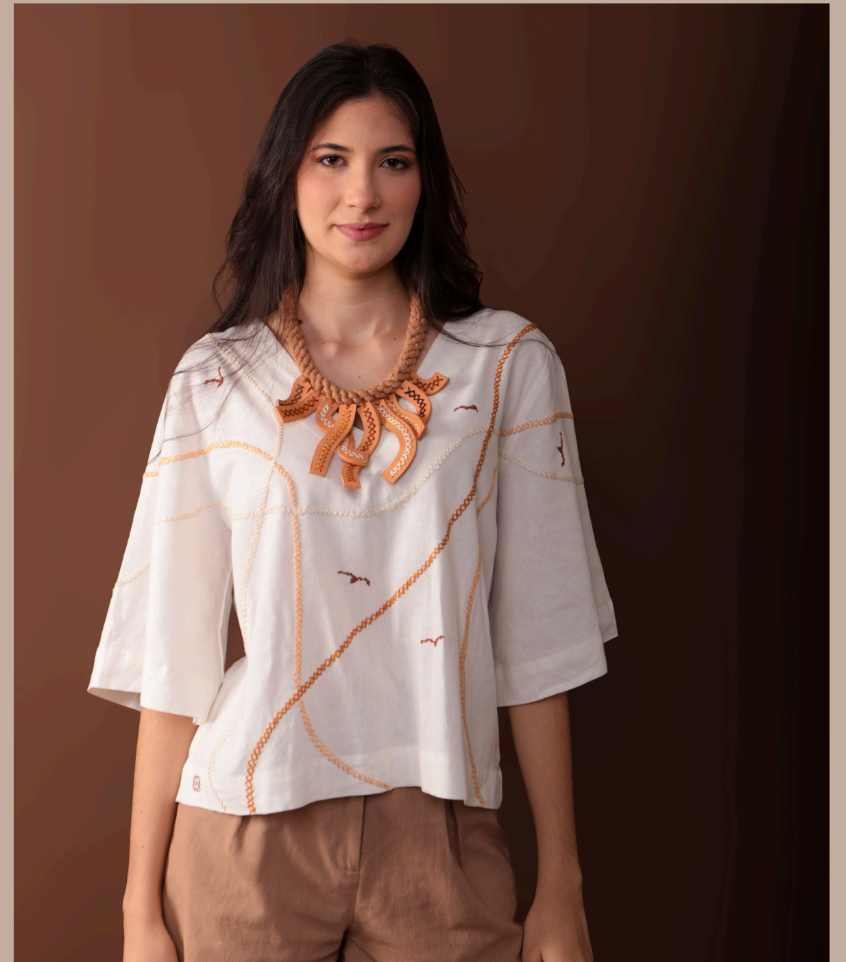
Blusa Alvorada - terrosos COD 7026001 520,00 Linho com algodão off white