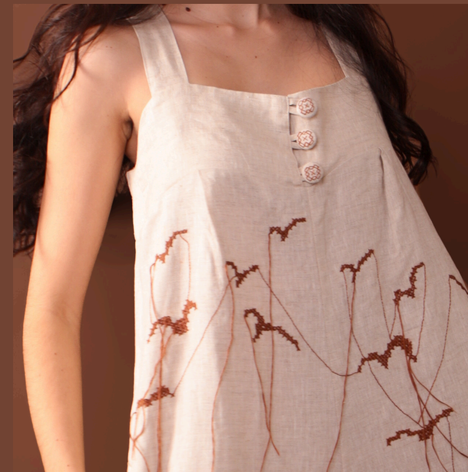
Macacão Ponto de Voo COD 7026004 880,00 100% Linho cru