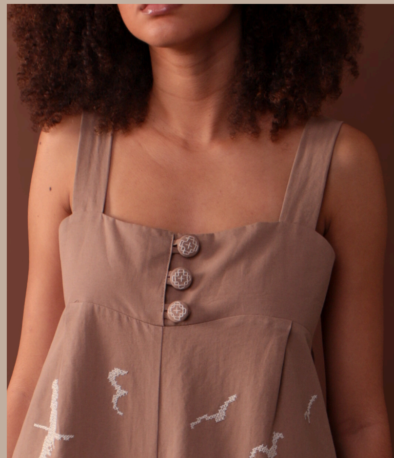
Macacão Revoada COD 7026003 680,00 100% algodão capuccino