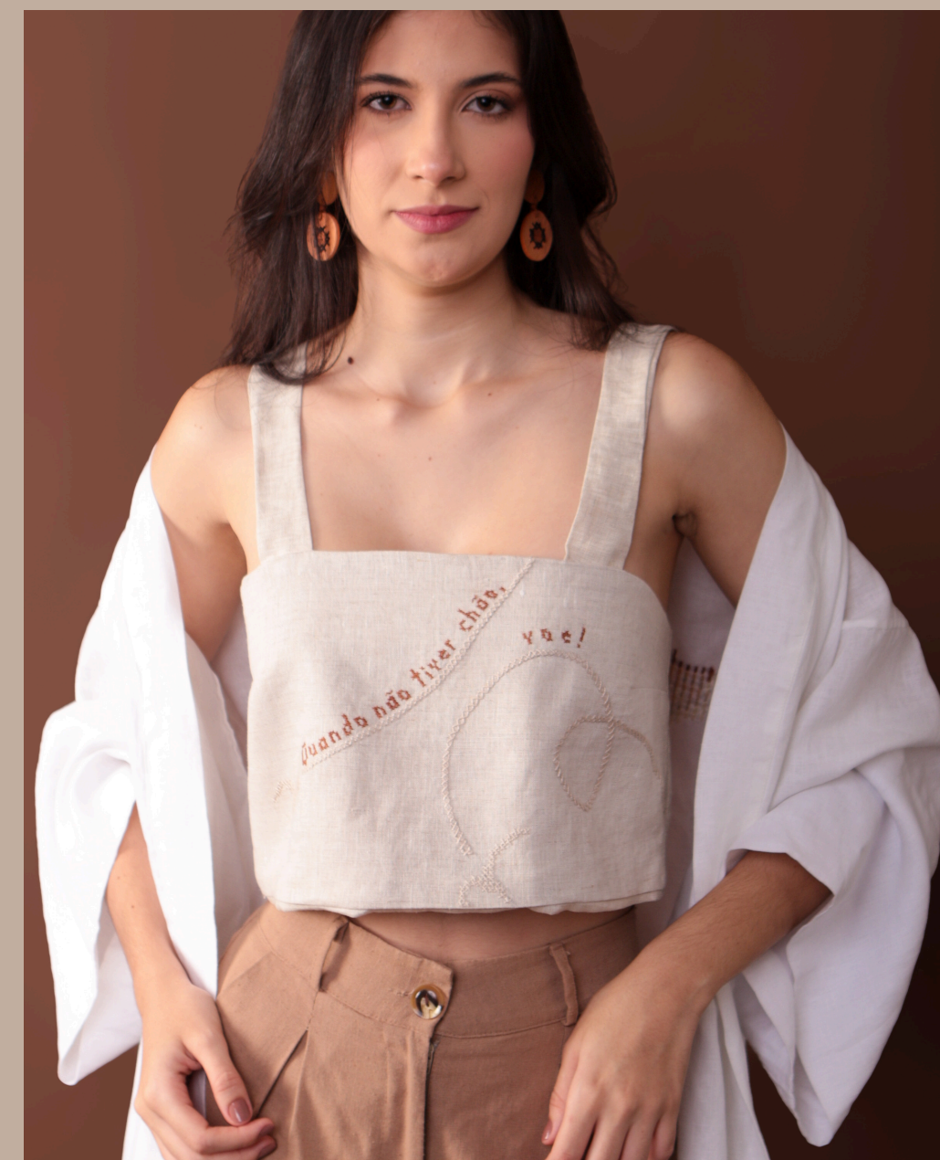
Kimono Asas COD 7026005 950,00 100% Linho branco