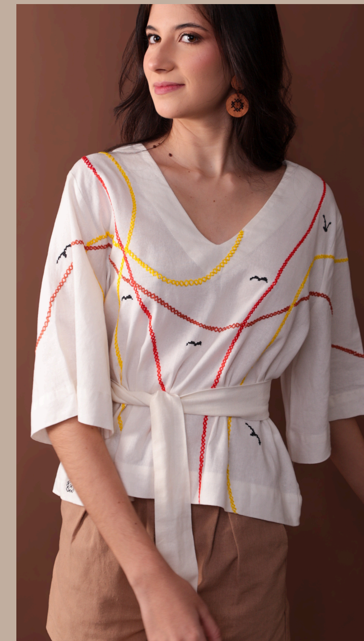
Blusa Alvorada - solares COD 7026001 520,00 Linho com algodão off white